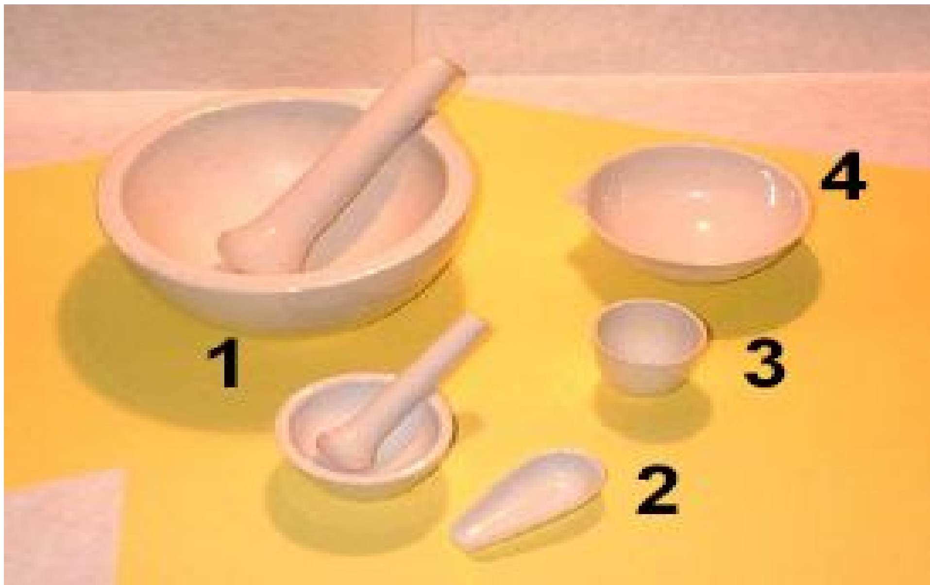
1-roztieračky,2- navažovacia lyžička,3-porcelánový téglík,4-odparovacia miska