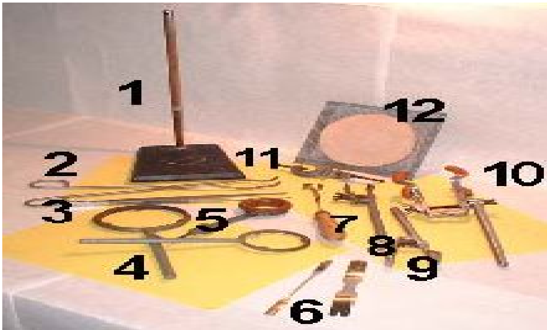
1-stojan,2-téglikové kliešte,3-pinzeta,4-železný kruh,5-filtračný kruh,6-špachtle,7-držiak na skúmavky,11-krížová svorka,12-azbestová sieťka